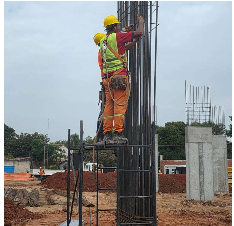
Trabajos de preparación de armaduras de pilares