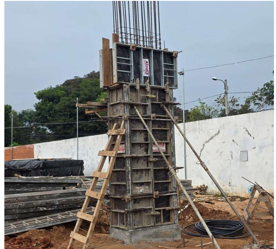
Trabajos de encofrado de pilares